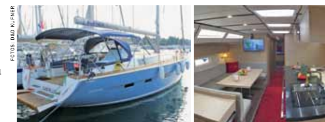
Die neueste Generation der Kufner 54, Test folgt.