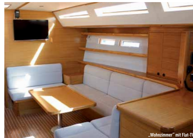
„Wohnzimmer“ mit Flat-TV.