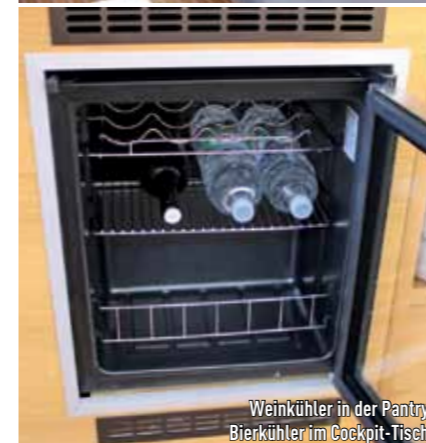
Weinkühler in der Pantry, Bierkühler im Cockpit-Tisch.