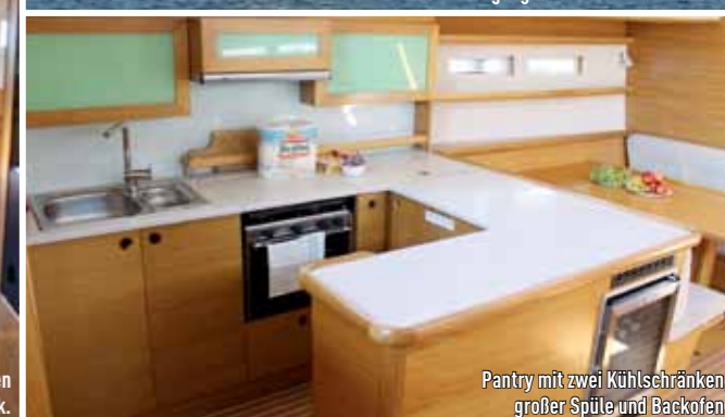
Pantry mit zwei Kühlschränken, großer Spüle und Backofen.

te, vier Nasszellen sind ebenfalls nicht Standard auf jedem Kat.