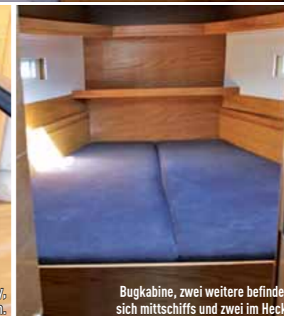
Bugkabine, zwei weitere befinden sich mittschiffs und zwei im Heck.