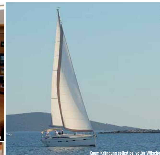
Kaum Krängung selbst bei voller Wäsche.